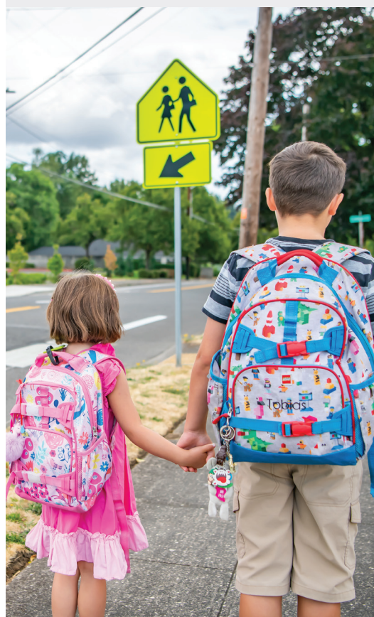
Học sinh đang trở lại trường học. Giúp các em đảm bảo an toàn bằng cách tuân thủ luật giao thông.

Trường học sắp khai giảng và Sở Cảnh Sát Vancouver đã sẵn sàng đảm bảo an toàn cho học sinh khi các em trở lại trường học. Đơn vị phụ trách giao thông của chúng tôi sẽ thường xuyên thực thi công tác an toàn khu vực trường học trong suốt cả năm.