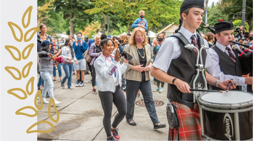
Jordan Chiles đã được trao tặng chiếc Chia Khóa Thành Phố sau khi giành được tấm huy chương bạc tại Thế Vận Hội Olympic 2020.