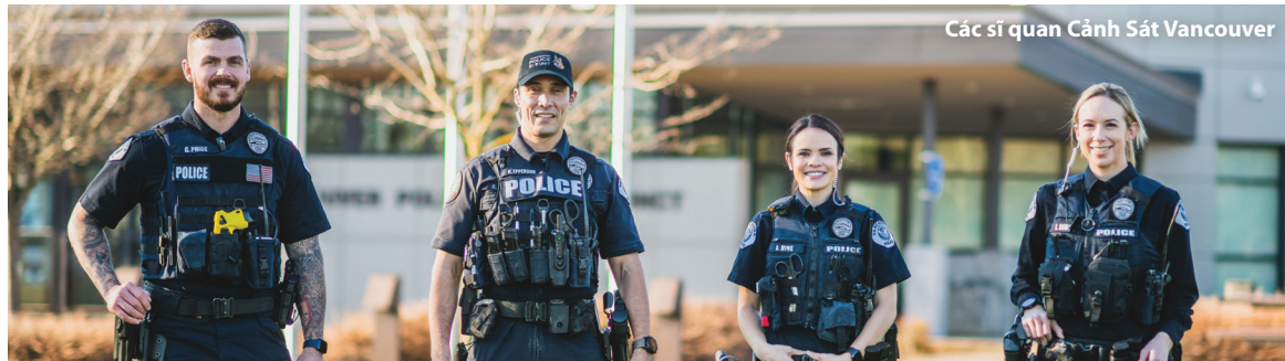
Các sĩ quan Cảnh Sát Vancouver

Quý vị có thể tìm thấy toàn bộ tiểu sử của ông Lon tại cityofvancouver.us/citymanager .