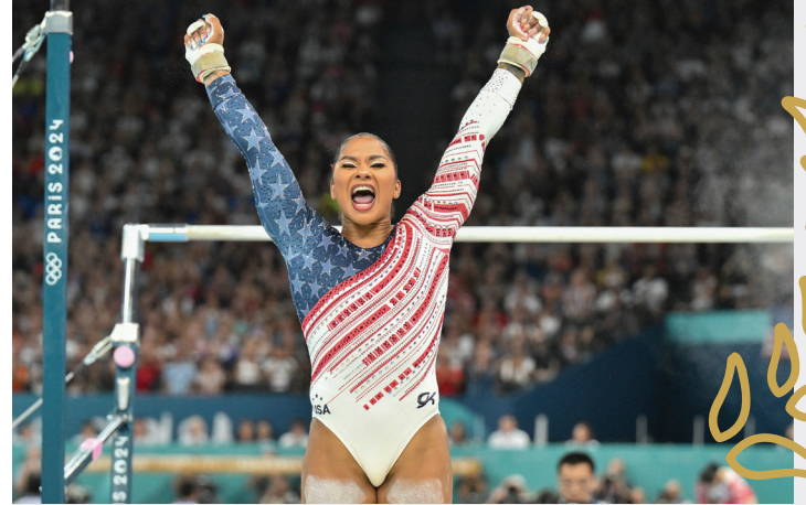
Jordan Chiles ăn mừng tại Thế Vận Hội Olympic 2024 ở Paris, Pháp.

Jordan Chiles của Vancouver đã tham gia tranh tài ở Thế Vận Hội 2024 tại Paris vào mùa hè này với tư cách là thành viên của Đội Tuyển Thể Dục Dụng Cụ Nữ Hoa Kỳ. Chiles đã mang về quê nhà tấm huy chương vàng ở nội dung Nghệ Thuật Toàn Năng Đồng Đội Nữ. Chiles lớn lên ở Vancouver, được đào tạo tại địa phương và tốt nghiệp Trường Trung Học Phổ Thông Prairie. Xin chúc mừng, Vancouver vô cùng tự hào về cô.